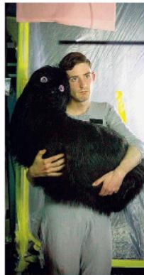
Lenz A sinistra un'immagine di «Infinite Crumple»; a destra di «Trash Vortex»

Se per «Infinite Crumple» il riferimento è il Paradiso dantesco, per «Trash Vortex» il pensiero è rivolto al Purgatorio, anche se tali intuizioni stimolano paiono lontane, forse utili so-