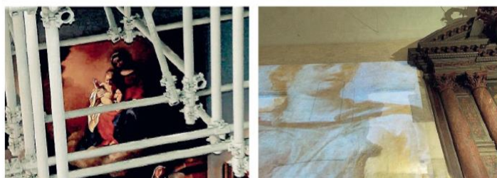
Lenz La conferenza stampa (in alto) e immagini della performance di musica elettronica e visual art «Imperial Staircase».

Tra i rigorosi principi in questo percorso alla scoperta e riscoperta del nostro territorio c'è sempre un grande rispetto per gli spazi storici «senza mai invadere, ma con il fine di testimoniare la presenza del passato: rivelandolo, quasi scomparendo».