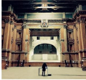
Lenz Due immagini della performance «Imperial Staircase».

«Tornate all'antico e sarà un progresso» diceva con lungimiranza Verdi: parole sante a giudicare dalla caldissima accoglienza di sabato della performance di musica contemporanea «Imperial Staircase» nel complesso monumentale della Pilotta realizzata da Lenz Fondazione con il nuovo direttore